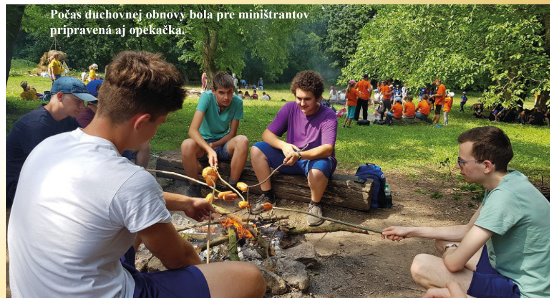
Počas duchovnej obnovy bola pre miništrantov pripravená aj opekačka.

Bol to pre nás veľmi požehnaný čas. Čas, v ktorom sme sa stretli s mnohými ľuďmi, čas plný rozhovorov s manželmi, ale i čas s Bohom. Počas týždňa sme mali možnosť počuť rôzne svedectvá manželov, ktorí prešli rôznymi radosťami, ale i úskaliaми v ich v spoločnom živote. Boli sme zadelení do skupiniek, v ktorých sme diskutovali na rôzne otázky, ktoré nám boli položené, a v ktorých sme sa viac spoznávali a my sme získavali lepší pohľad na manželstvo, na rodinu, ktorý využijeme v budúcej pastoračii