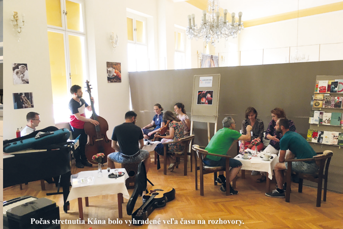
Počas stretnutia Kána bolo vyhradené veľa času na rozhovory.

kňaza. Jeden deň v týždni sa niesol v atmosfére odpustenia a zmierenia. Pre mňa osobne bol tento deň veľkým povzbudením. Vidieť jednotlivé páry, ako si navzájom odpúšťajú, je najkrajším a veľmi povzbudivým momentom. V predposledný deň si manželské páry obnovili svoje manželské sľuby a na znak vzájomnej lásky bol pre nich od organizátorov pripravený svadobný večer.