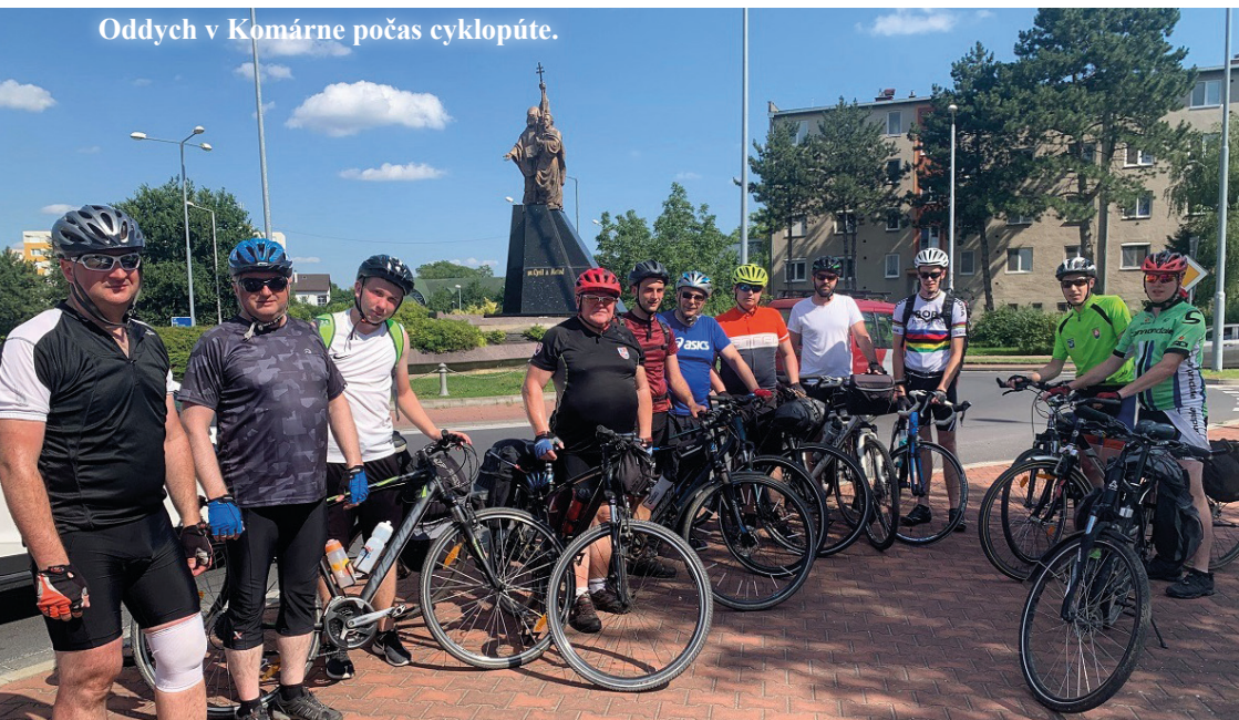
Oddych v Komárne počas cyklopúte.

Redakcia časopisu Gorazd, Samova 14, 949 01 Nitra / gorazdcasopis@gmail.com