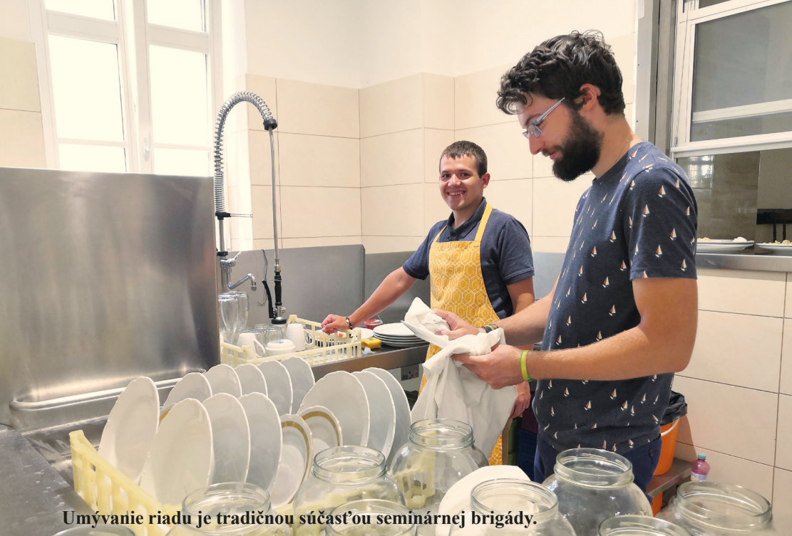
Umývanie riadu je tradičnou súčasťou seminárnej brigády.