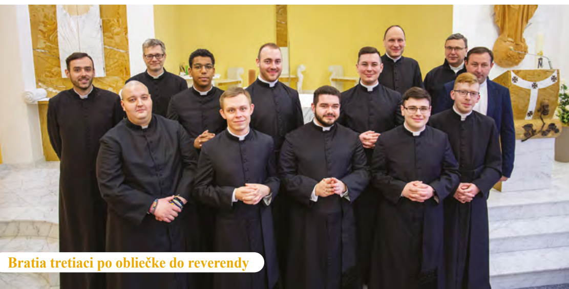
Bratia tretiaci po obliečke do reverendy

Deň, kedy sa otvorili brány seminára pre miništrantov, pre ktorých bol pripravený bohatý program, ktorého súčasťou bolo slávenie sv. omše, rôzne aktivity a adorácia Najsvätejšej sviatosti.