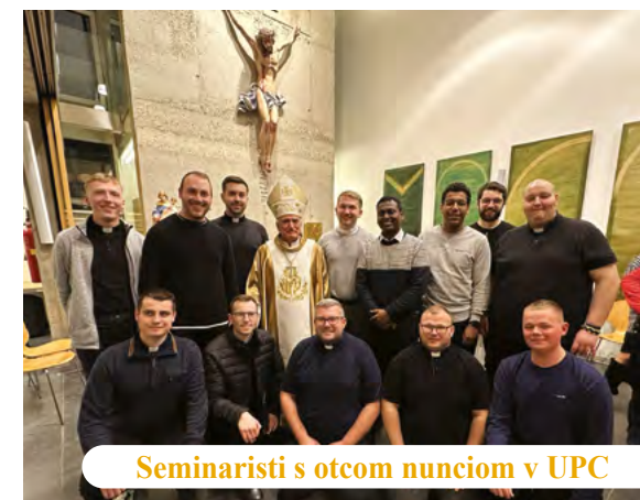
Seminaristi s otcom nunciom v UPC