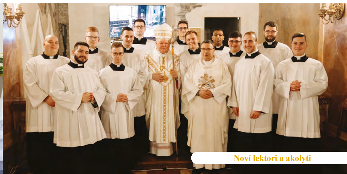
Noví lektori a akolyti